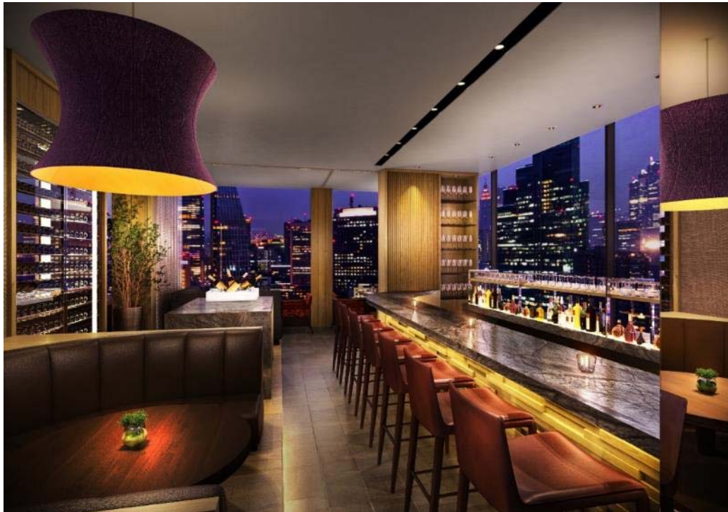
<レストラン(バーラウンジ)>

当ホテルの最上階には、東京・青山に本店を構える、高いホスピタリティが話題のイタリアンレストラン「Casita」が、銀座初出店します。ホテルの中のもうひとつの「あたたかい家」をテーマに、ひとの温かみを感じられるダイニングとして、お客さまをおもてなしいたします。銀座の夜景を背に、「Casita」の意味である「おうち」のような温かさを感じるインテリアデザインを採用しており、深夜はバーラウンジとして、「大人の隠れ家」と呼ぶにふさわしい空間をお楽しみいただけます。本店舗は、カシータグループが展開するレストランの、最上級のフラッグシップとして開業予定です。