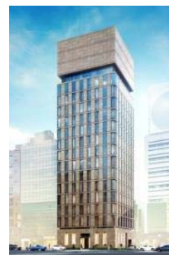
<ホテル ザ セレスティン銀座 外観 >