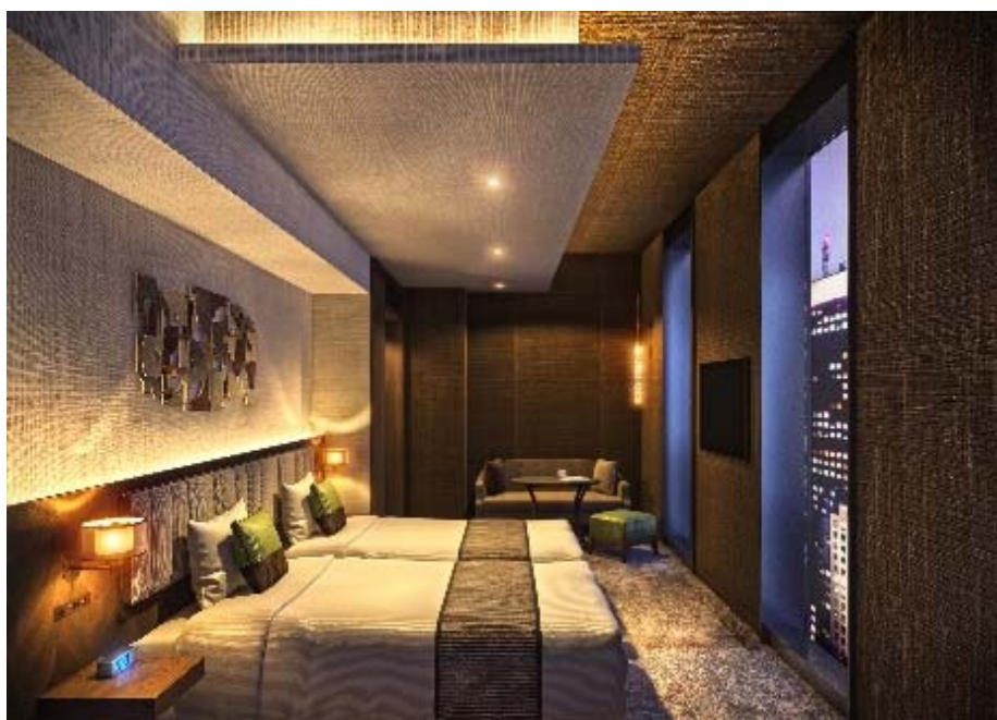
<スーパーアツイン>