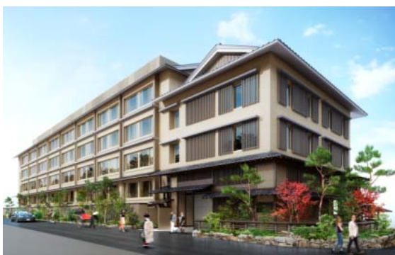
<ホテル ザ セレスティン京都祇園 外観>